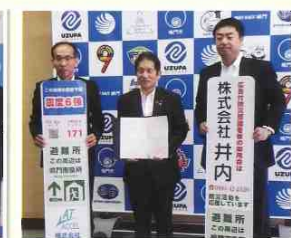
●令和元年10月1日 鳴門市と 協力協定を結びました。