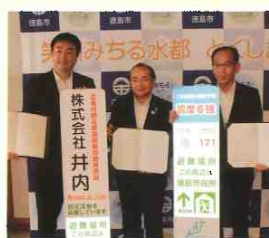
●令和元年7月23日 徳島市と 協力協定を結びました。

そこで、民間企業として防災案内看板の設置を後押ししようと考えました。 近年、企業として社会的責任が問われる中、この防災電柱広告を通し、各企業 様の地域・社会貢献を果たす一つの手段としてご利用頂ければと願っていま す。何卒、この趣旨にご賛同いただき応援下さるよう宜しくお願い致します。