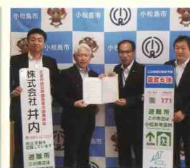
●令和元年8月19日 小松島市と 協力協定を結びました。